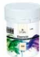
Esencia 25 ml 100 ml