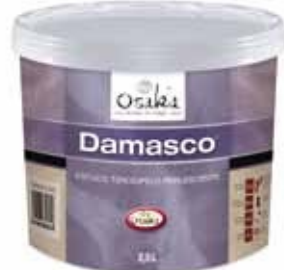
Damasco 2,5L (6-8m 2 /L)