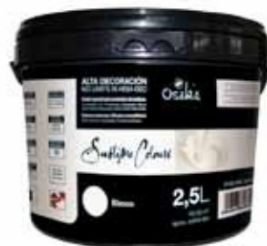
Sublime Colours 2,5L (10-12m 2 /L)

4) Μπορείτε εάν θέλετε όταν έχετε περάσει το δεύτερο χέρι και το χρώμα δεν έχει στεγνώσει να σπατουλαρετε την επιφάνεια με ανοξείδωτη η πλαστική σπάτουλα προσθέτοντας η αφαιρώντας υλικό. Αυτή η διαδικασία είναι εύκολη και δεν χρειάζεται κάποιον εξειδικευμένο εφαρμοστή.